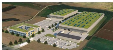
Das Werk von Interroll Conveyor

Durch eine notwendig gewordene Umfirmierung unter dem Namen Interroll Conveyor stehen nun in den Werken Mosbach und Sinsheim Betriebsratsneuwahlen an. Die IG Metall unterstützt die Wahlvorstände vor Ort. Der Betriebsbetreuer Marc Berghaus freut sich: »Ich bin