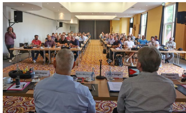
Volles Haus bei der Betriebsrätekonferenz der IG Metall Heidelberg 2022

Eine gute Sache für Auszubildende und Betriebe!