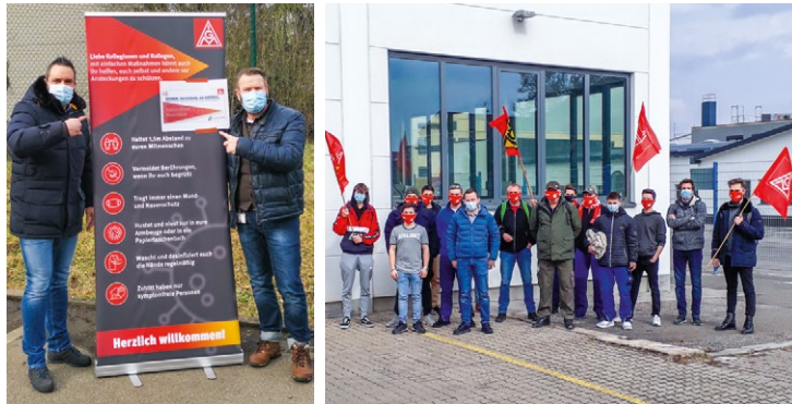
Tarifaktion bei KS Gleitlager (l.) und Warnstreik bei Lisi (r.)