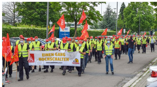
Demozug rund um die Niederlassung in Heidelberg 2021

von Auszubildenden im Tarifergebnis eine Rolle spielen. In der Mercedes-Benz-Niederlassung in Heidelberg beteiligten sich sehr viele Beschäftigte bereits Ende März an einer aktiven Mittagspause. Die Metallerrinnen und Metaller dort sind gut geübt. In der letzten Tarifrunde veranstalteten sie einen Demozug rund um die Niederlassung in Rohrbach, um Druck für ihre Forderungen zu machen. »Sollte es notwendig werden, stehen wir wieder bereit«, so der Tenor vieler Beschäftigter.