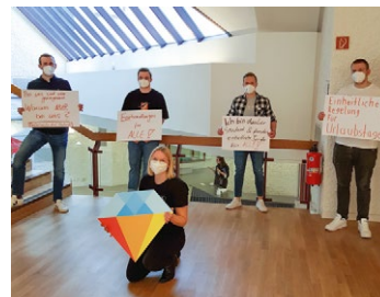
Dual Studierende aus Heidelberger IG Metall-Betrieben begleiteten die Verhandlungen.