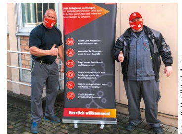
Mit einer Tarifaktion waren auch die Beschäftigten bei TI Automotive Systems dabei.