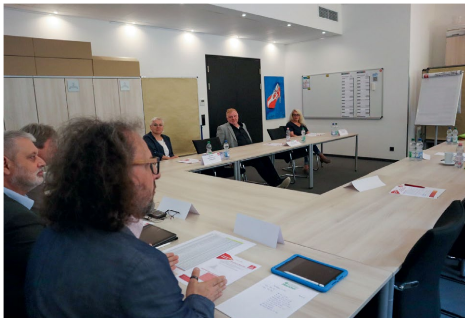
Pressekonferenz der IG Metall Heidelberg am 9. Juni

MITBESTIMMUNG Die IG Metall Heidelberg gibt die Trends und Highlights der abgeschlossenen Betriebsratswahlen auf ihrer Pressekonferenz bekannt.