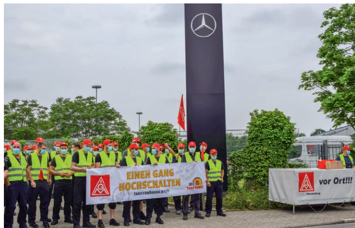
Jetzt gehts los!