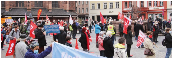
Der Rathausplatz am 1. Mai

Redaktion Mirko Geiger (verantwortlich), Ulrike Zenke Anschrift IG Metall Heidelberg, Friedrich-Ebert-Anlage 24, 69117 Heidelberg Telefon 06221 98 24-0 | Fax 06221 98 24-30 heidelberg@igmetall.de | heidelberg.igm.de