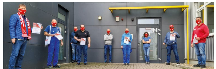
Die Vertrauensleute bei ABB Stotz-Kontakt verteilten Aufrufe zum Warnstreik.

Weitere Eindrücke der Warnstreiks findet Ihr auf unserer Homepage unter: heidelberg.igm.de