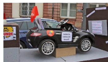
Kfz in der Tarifpresse

tätigung des IG Metall-Notauschalters ließ die Maschine von den Errungenschaften der Tarifverträge im Kfz-Handwerk ab und ging in Rauch auf.