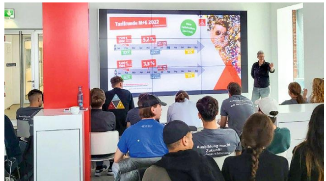
Unsere Tariferfolge im Überblick beeindrucken und verdeutlichen die Wichtigkeit von Gewerkschaften – vor allem in Bezug auf das Lohnniveau.