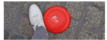
Frisbee-Scheiben sorgten am 1. Mai für Abstand.