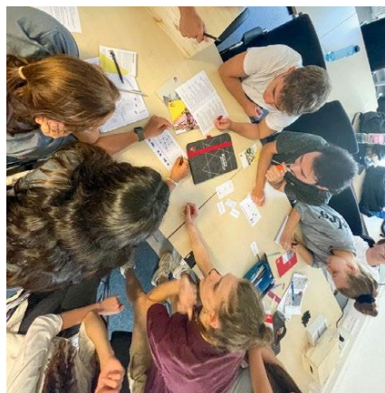
Studierende bei ABB versuchen, die Rätsel zu lösen.

Die Jugend- und Auszubildendenvertretung von ABB in Heidelberg hat sich ein großes Ziel gesteckt: »Wir wollen besser werden in der Ansprache von dual Studierenden!« Sie haben sich mit einem Escape Game eine spielerische Methode überlegt, um die Wichtigkeit von betrieblicher Mitbestimmung und Gewerkschaften zu unterstreichen. Und das mit großem Erfolg. So viele wie noch nie haben sich entschieden, Mitglied der IG Metall zu werden.