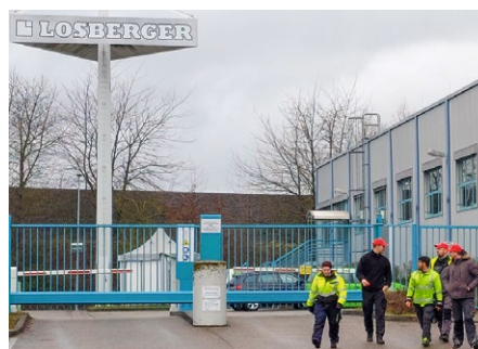
Tor zu! Schluss für heute! Erster Warnstreik bei Losberger seit 2017

So geschah es, dass diese Tarifrunde einen Betrieb auf den Plan rief, der vorher eher unbeteiligt war: Losberger in Fürfeld. Um den Arbeitgebern ein unmissverständliches Zeichen zu senden, beteiligten sich die Beschäftigten bei Losberger an den Warnstreiks. Und das gleich zweimal. Die eindeutige Botschaft an die Arbeitgeber: »Ihr müsst Euch bewegen, sonst bewegen wir uns!« Das hinterließ bei den Arbeitgeberver-