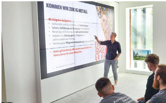
Begrüßungsrunde von Auszubildenden und dual Studierenden