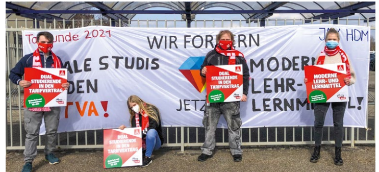
Aktion der Jugend bei Heidelberger Druckmaschinen